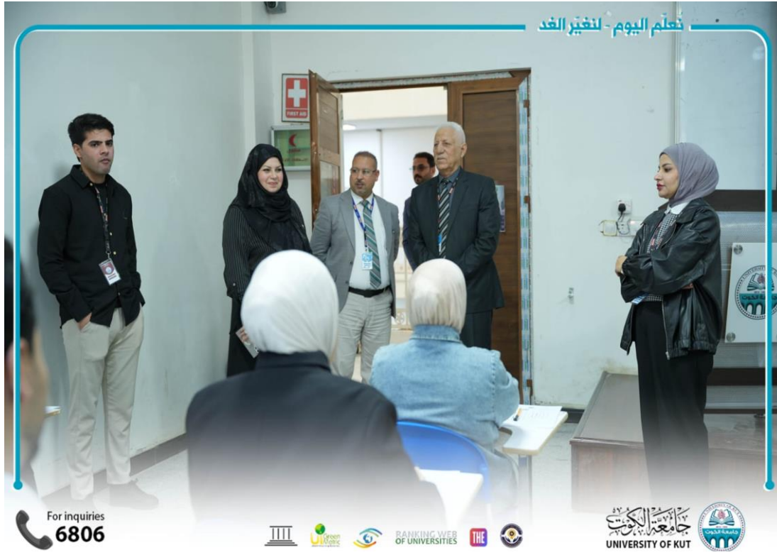
نُعلّم اليوم - لنغيّر الغد

تستمر كلية التقنيات الصحية والطبية في إجراء امتحان المد للفصل الدراسي الثاني للعام الدراسي (2025-2026) لأقسام ( تقنيات المختبرات الطبية ، تقنيات التجميل والليزر ، وتقنيات الكلية الصناعية ) ، وسط تنظيم وانسيابية عالية .