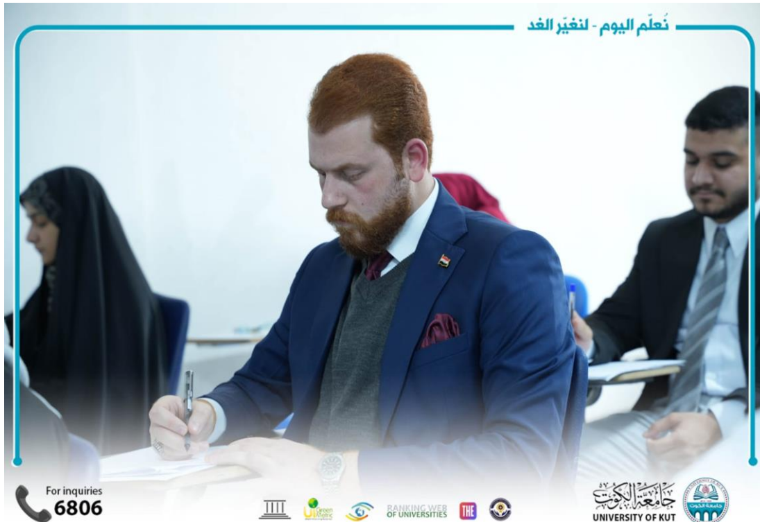
نُعلّم اليوم - لنغيّر الغد