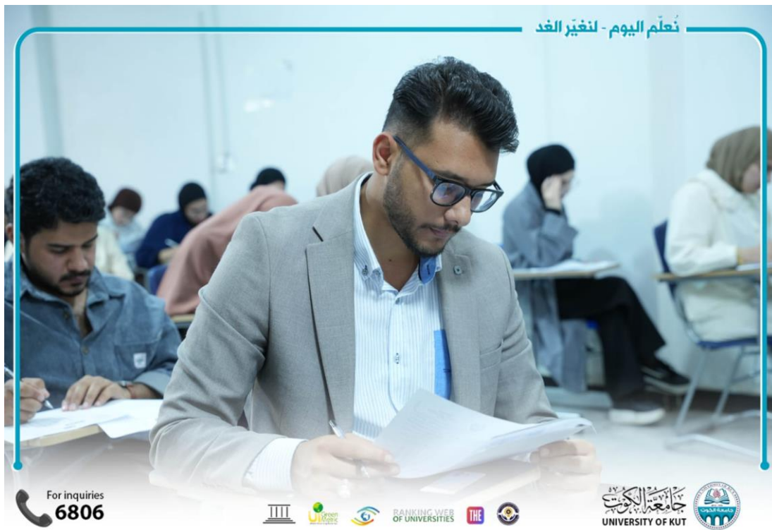
نُعلّم اليوم - لنغيّر الغد